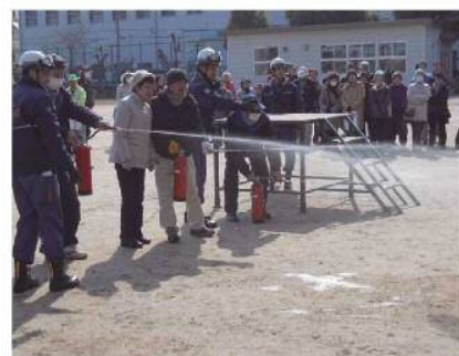
消火訓練(水消火器)