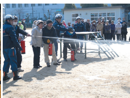
消火訓練（水消火器）