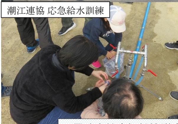
潮江連協 応急給水訓練