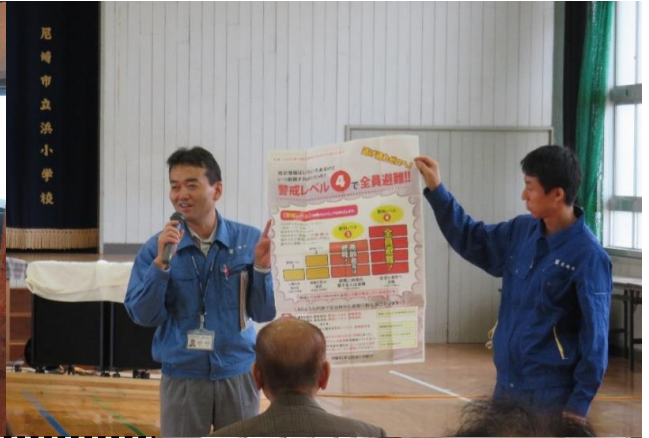
尾崎市立浜小学校

地域で防災講座・ 防災訓練が開催されました。 ご近所同士で いざという時のために備えましょう！