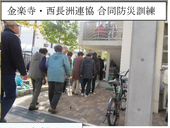
金楽寺・西長洲連協 合同防災訓練

尼崎市社会福祉協議会小田支部 電話：6488-5443 F A X：6488-5459 メ-ル：oda@amasyakyo.jp