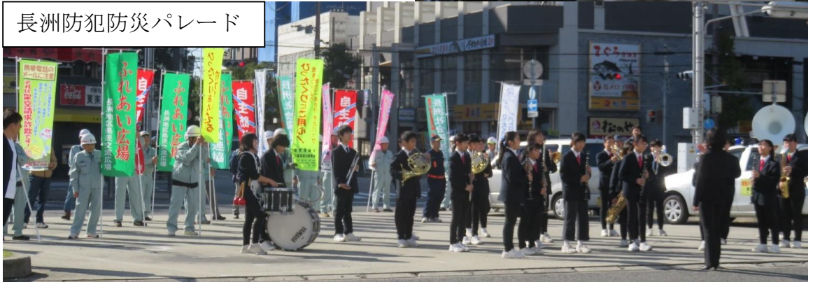
長洲防犯防災パレード