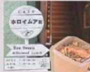
カフェホロイムア