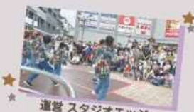
運営 スタジオエッジ