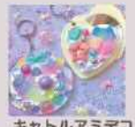
キャトルアミデコ