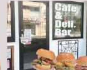
CAFE & DELI EARLY BIRD