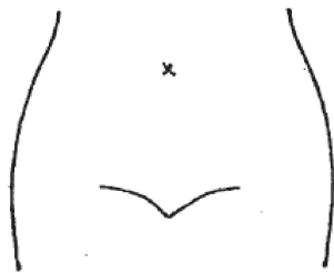
(ストマ及びびらんの部位等を図示)