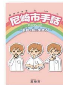
尼崎市手話パンフレット