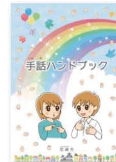
手話ハンドブック