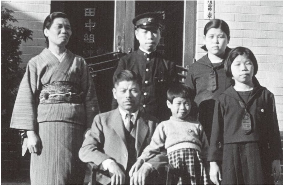
旧事務所前での家族写真