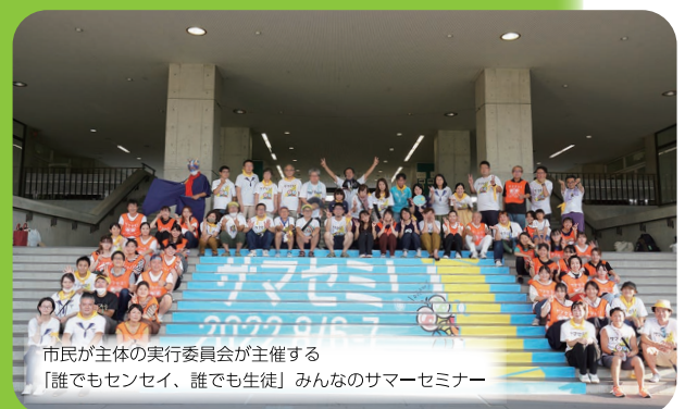
市民が主体の実行委員会が主催する 「誰でもセンセイ、誰でも生徒」みんなのサマーセミナー

市民が本市の歴史・文化や地域に誇りと愛着を抱き、大切に育むことで、本市が多くの人々を引き付ける魅力あるまちとなることを目指します。