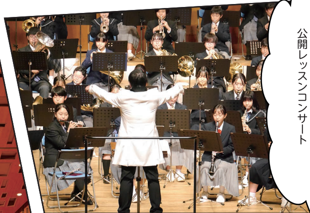
大植英次 中学・高校吹奏楽部 公開レッスンコンサート