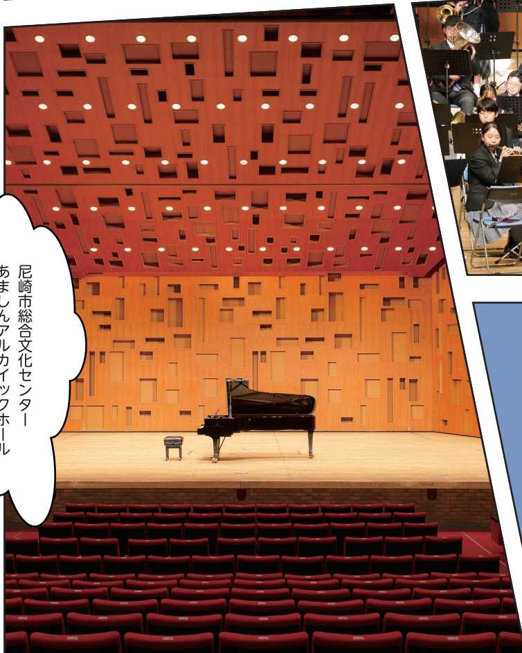
尼崎市総合文化センター あましんアルカイックホール