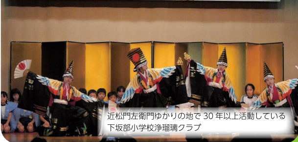
近松門左衛門ゆかりの地で30年以上活動している 下坂部小学校浄瑠璃クラブ