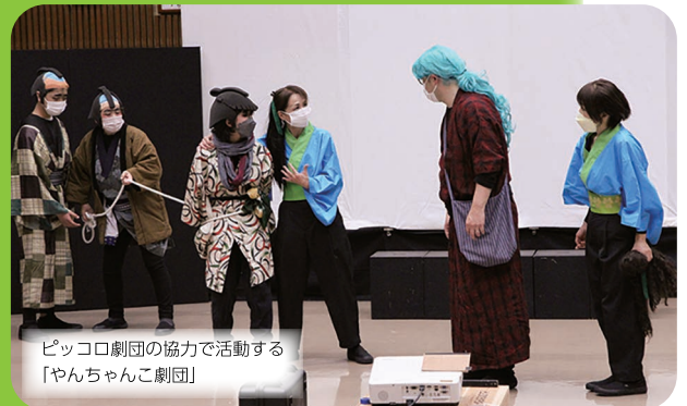
ピッコロ劇団の協力で活動する 「やんちゃんこ劇団」

市民が学び・楽しみ・交流しているまちは、まちに個性や新たな価値を創造し、その個性・価値がまちの一人ひとりに根付くことにより、市民の生活価値として定着していきます。そして、人と人がコミュニケーションをとり、共感し合う関係を生みだし、人間関係を形成していきます。その中でも、とりわけ文化・芸術は市民の心に必要なものであると同時に、健やかな暮らしを支えるためにも不可欠なものです。本市に自由で創造的な活動やそれに触れる機会があふれることは、市民の生活価値を高め、市民が社会で生きていく力になります。