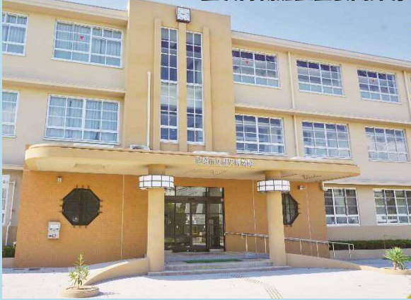
歴史博物館正面玄関部分

常設展や企画展などの開催により、尼崎の歴史や魅力を広く発信することで、まちに対する誇りや愛着を支えていく