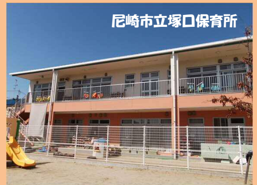
尼崎市立塚口保育所

悩みを抱える子どもたちに働きかけるスクールソーシャルワーカーを増員し、全中学校区に配置