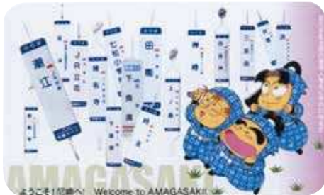
忍たまのキャラクターと登場人物にちなんだ地名がデザインされた 「影の尼崎観光特使」カード

学生時代には日本史を専攻し、特に中世の歴史に 興味を持ちます。時代考証にこだわり、文献、刀剣、 火縄銃等も収集します。