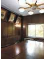
▲会議など活動に使える貴賓室

大庄公民館から歩いて10秒の位置にある喫茶店「友人」の皆さん。公民館の事業に参加するのは初めての方ばかりで「尼崎が古いまちとは知っていたけどこんな良い建物が残っていると知りませんでした。貴賓室など歴史ある部屋が今も使える形で残っているのは嬉しいですね」と尼崎市民の店のオーナーは初めて知る歴史に感慨深げ。オーナーの妻は「壁が曲線になっていて建物の設計はノアの箱舟がモ