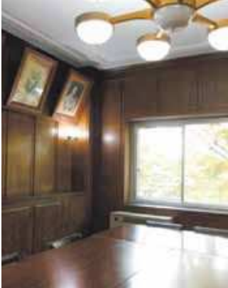
◀旧貴賓室 2階の旧貴賓室には竣工当初の内装が現存しており、当時は大庄村役場の村長室でした。現在は学習室のひとつとして利用されています。