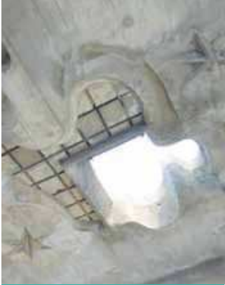
◀塔屋天井のレリーフ 屋上にある塔屋の天井には、村野藤吾が描いたスケッチをもとに制作された星・月・雲のレリーフがあります。