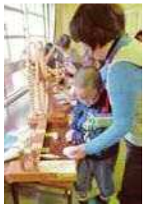
▲糸車で綿が糸に変身