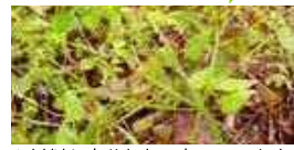
▲材料も自分たちで育てています。

結成15年目。メンバーは38人。 ▼こんなことしてます 藍染、機織り、人形劇など、子どもたちに体験を通して歴史や昔のくらしを伝える活動をしています。学習会で使う綿や藍を自分たちで育て、体験学習の内容を実際に学び、学んだことを伝える、という3つを大事にしています。 ▼活動の声 夏の藍染体験学習会に参加して活動に興味があり、参加しました。学習会に参加した子どもたちが満足そうに帰っていくのを見るとやがいが感じます。