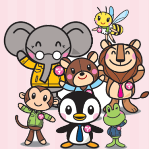
ひょうご仕事と生活センターキャラクター-WLB7