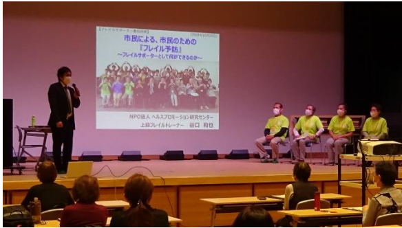
令和2年度フレイルサポーター養成研修の様子