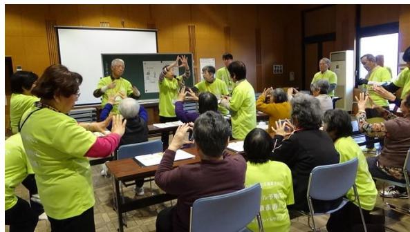
▲フレイルチェックの様子

住民活動の場やプラザなどでフレイルチェックの運営を行うボランティアです。具体的にはフレイルチェックの場でフレイルに関する説明をしたり、質問票・機器を使ったチェック、日常生活で気を付けるべきポイントの啓発等を行っています。現在は月に2~4回程度活動しています。