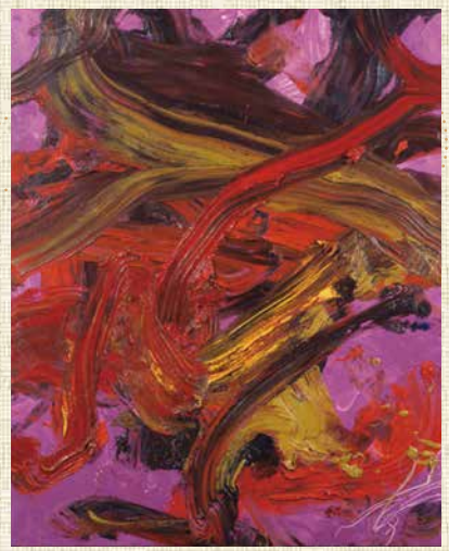
白髪一雄「天女の舞」