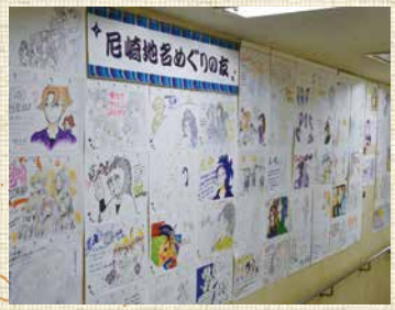
市役所にはファンのみさんのイラストがずらり