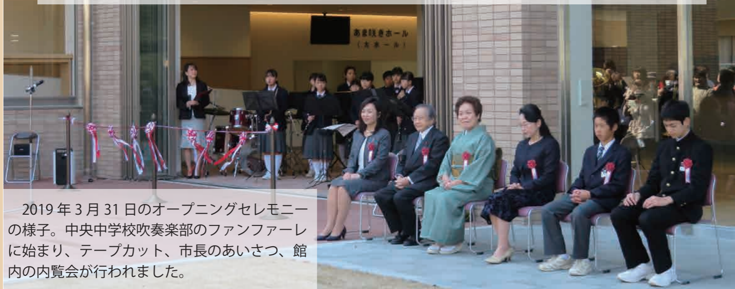
2019年3月31日のオープニングセレモニーの様子。中央中学校吹奏楽部のファンファーレに始まり、テープカット、市長のあいさつ、館内の内覧会が行われました。

2019年4月、生涯学習と自治のまちづくりを支える拠点として「中央北生涯学習プラザ」がオープンしました。それから5年、コロナ禍の大変な時期も経験しながら、たくさんの学びやつながりがこのプラザから生まれています。