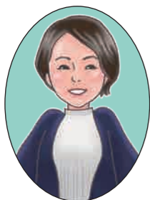
竹谷小校区担当 くきの

また、初めて会った人にも積極的にコミュニケーションを取るなど、新しい物事を受け入れる力がすごいと感じています。挨拶もしっかりできる自慢の竹谷っ子、地域の皆さんに見守られすくすく成長しています！