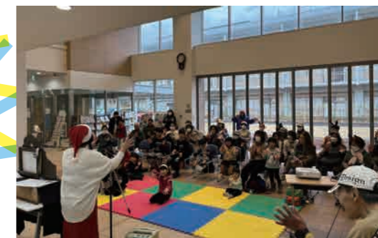
クリスマス会は大盛況で124人の参加がありました