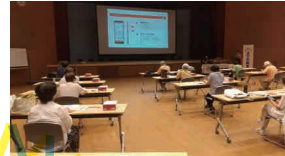
実機を使ったスマホ教室