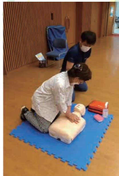
AED講座には消防局の職員に来ていただきました