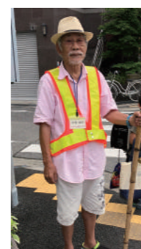
西難波では おじ様達がお見送り

難波小学校に通学してくる子ども達を、警察官、あましん難波支店さん、地域のボランティアさん達がいつも見守ってくれています。