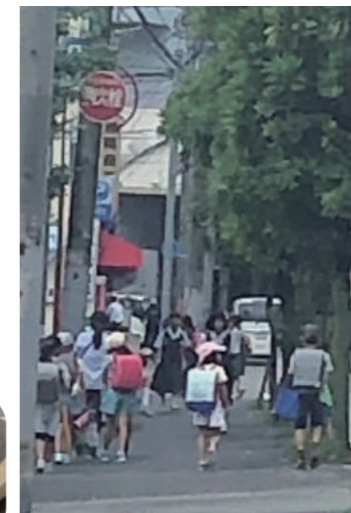
まだまだ眠そうな 子ども達もみんな 元気にごあいさつ