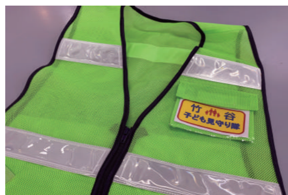
見守り隊のベストは目立つように、蛍光色です