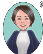
竹谷小校区担当 ききの

取材してみて、竹谷小の図書室は色々な方の優しさで出来上がった図書室だとわかり、その優しさが温かく感じ、とても居心地がよかったです。季節の飾り付けや階段アートは、細かいところまでこだわられています。竹谷小学校に行かれた際は、ぜひ図書室周りのボランティアさんの作品、ぜひご覧くださいね。