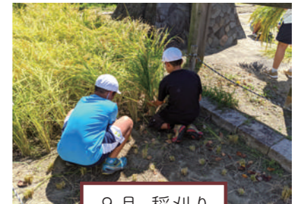
9 月 稲刈り