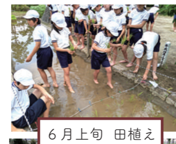
6 月上旬 田植え