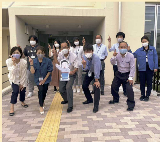
▲園田地域課のみなさん