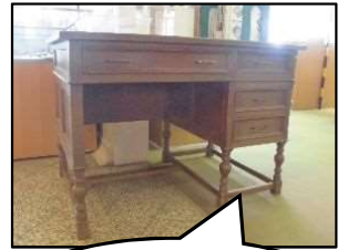
歴史を感じる木製の机

いただいた品々は今後、図書館で大切に使用させていただきます。ありがとうございました。