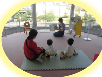
かしきりおはなしレストラン♪