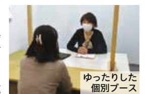
ゆったりした個別ブース

同ステーションは、求職者に合いそうな就職先をいくつか紹介して終わりではありません。どんなことを大切に就職支援を行っているのかなどを、就労支援員に聞きました。