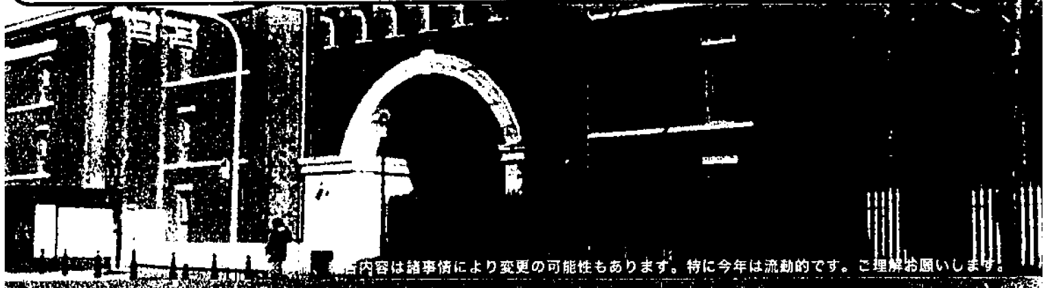
※当日内容は諸事情により変更の可能性もあります。特に今年は流動的です。ご理解をお願いします。