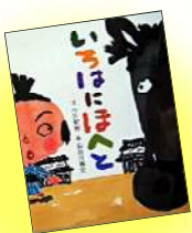
『いろはにほへと』 今江祥智/文 長谷川義史/絵 (BL出版)