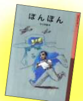
『ほんほん』 今江祥智/著 (岩波書店)