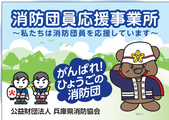
▲消防団員応援事業所ステッカー

自分たちのまちは自分たちで守る」をモットーに、地域で活動している消防団員を地域全体で応援する事業です。