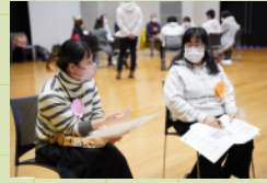
公園運営について意見交換する