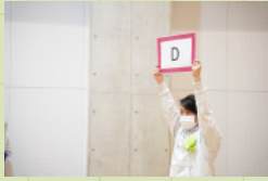
4チームに分かれる