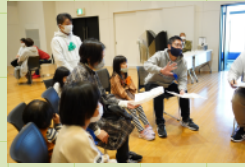
ゾーニングについて意見交換する