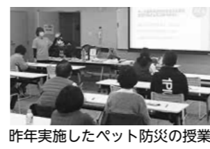
昨年実施したペット防災の授業

11月19日～22日、みんなが先生、みんなが生徒をモットーにした「オトナのまなびバル」(1026556)を開催します。同イベントは、地域の人がそれぞれの得意分野を教え合うことで学習機会を広げ、参加者同士の出会いの場とし、地域への関心・愛着を高めてほしいという思いで毎年開催しています。今年度は「アート」「健康」「動物」など日ごとにテーマが異なり、知的好奇心をかき立てられるような内容となっています。オトナだけでなく子どもも参加ももちろん大歓迎!