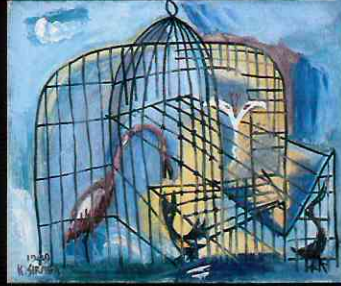
《鳥籠》1949年 キャンバスに油彩 尼崎市蔵