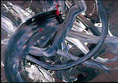
《切利天》1975年 キャンバスに油彩 当館蔵