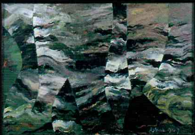
《流脈1》1953年 キャンバスに油彩 尼崎市蔵