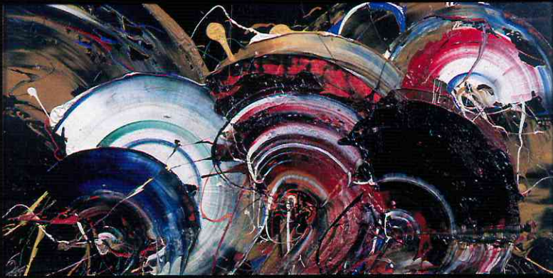
《視いの舞》1981年 キャンバスに油彩 公益財団法人 尼崎市文化振興財団蔵