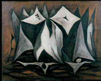
《本能の結集》1952年 キャンバスに油彩 尼崎市蔵

白髪一雄(1924-2008)は、戦後日本の前衛美術のなかでも重要な集団、具体美術協会(具体)の中心メンバーのひとりとして知られています。その独自の抽象絵画表現は、国際的にも高く評価されています。