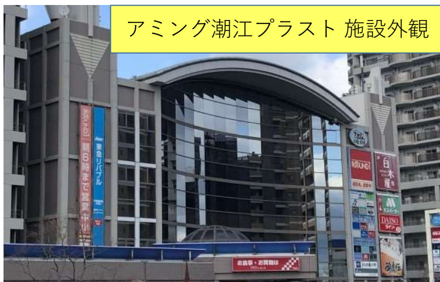
アミング潮江プラスト 施設外観