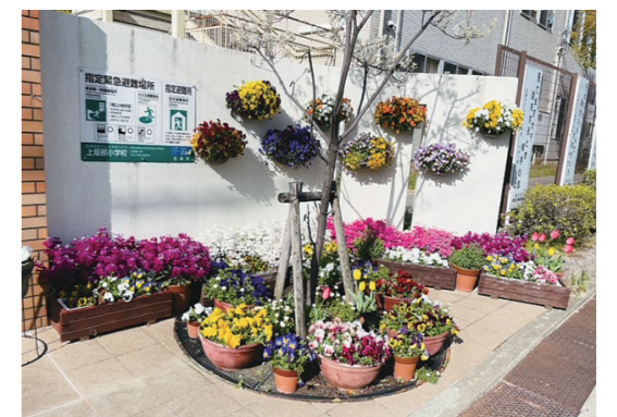
昨年度の学校緑化部門で入賞した花壇

入賞作品は、来年春に上坂部西公園の展示施設で開催予定の写真展でパネル展示します。