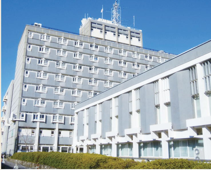
市庁舎の独創的なデザインは、時代を超えた魅力があると市内外で評価されています