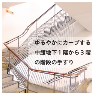
ゆるやかにカーブする中館地下1階から3階の階段の手すり