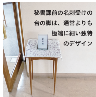
秘書課前の名刺受けの台の脚は、通常よりも極端に細い独特のデザイン