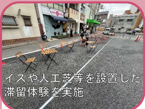
イスや人工芝等を設置した 滞留体験を実施

第1回園田豊中線タウンミーティングの際に募った意見のうち、実現した場合現地に常設されるものについて、実際の規模感を現地で確認しながら、阪急園田駅前に必要なものを考えてもらいました。