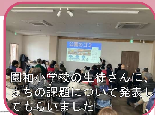
園和小学校の生徒さんに、 まちの課題について発表し てもらいました

図書館や交番があると便利 だし安心だけど、ここに設 置すると駅前広場がなくな る。