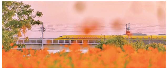
ドクターイエローとコスモス 令和4(2022)年度武庫川髭の渡しコスモス園 「フォトコンテスト」入賞作品

今月は、武庫川のコスモス園を紹介します。武庫川河川敷東側(常松2丁目と西昆陽4丁目)に大きく広がり、約550万本のコスモスが咲きそろう阪神間最大級の「武庫川髭の渡しコスモス園(☎10005727)」は、毎年市内外からたくさんの方が訪れる本市の秋の風物詩ですが、一体、誰が咲かせているのでしょうか。 不法投棄の山に地域の皆さんが立ち上がった 以前は、同河川敷は不法投棄されたごみで荒れていました。この状況を何とかしようと、平成15(2003)年に地域住民を中心にボランティアグループ「髭の渡し花咲き会」が発足。同会のメンバーをはじめ、事業者や学校、幼稚園など、さまざまな人たちの協力により、現在の見事な同園に生まれ変わりました。 出会えたらラッキー！ コラボ写真を狙え！ 満開の同園では、写真を撮らずにはいられません。さらに同園には、あるものとのコラボ写真を撮るため