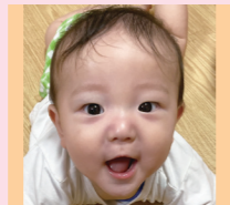
丞汰朗ちゃん R04年11月生 甘え上手な丞くん! 家族みんながメロメロ♡