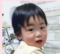
舜斗ちゃん R03年8月生 パパよりも長身でイケメンに育ちますように