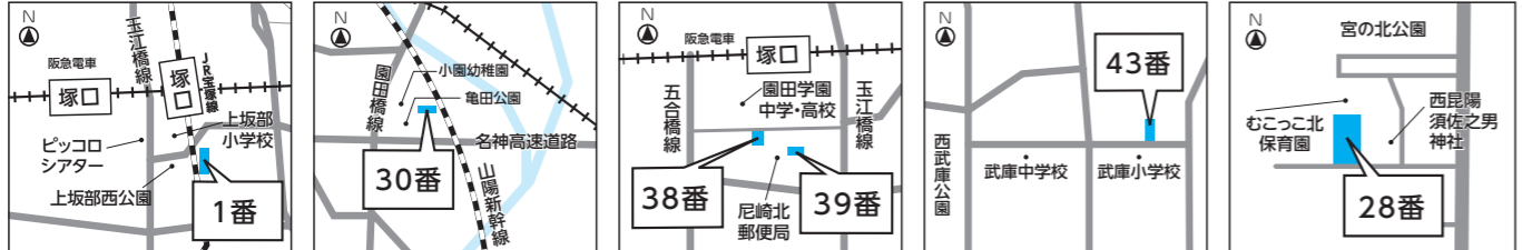
1番農園(上坂部2丁目) = 39(2) 30番農園(小中島3丁目) = 58(3) 38番農園(南塚口町6丁目) = 54(3) 39番農園(南塚口町5丁目) = 35(2) 43番農園(常吉2丁目) = 13(1) 28番農園(西昆陽3丁目) = 若干数