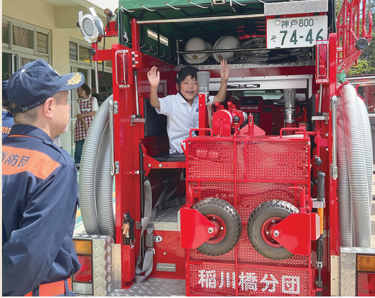
親子救急教室では、普段は入れない消防車の中に入れて、大喜び!