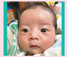
ひびき 響ちゃん R05年11月生 我(わ)が家のイケメン!

問 問い合わせ先 申 申し込み 対 対象者 費 費用 先 先着順で受け付ける定員 申 申し込み多数の場合は抽選する定員 休 休館日 託 託児 手話通訳などあり。料金表示のないものは無料です(有料広告を除く)