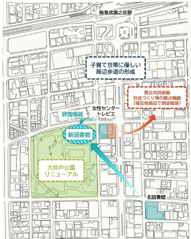
一体整備の対象施設と方向性

本市では、これまでも人口減少や少子高齢化、財政状況等を踏まえ、公共施設の量・質・運営コスト等の最適化を目指す公共施設マネジメントや、鉄道駅周辺のエリアブランディングに取り組んでいます。この度、老朽化が進んでいる北図書館と女性センタートレピエの再整備とともに、新図書館の整備場所となる大井戸公園や周辺歩道を含めた整備を、地域の課題解決と魅力向上のため、まちづくりの視点で一体的に行い、ファミリー世帯の定住・転入促進につなげていきます。